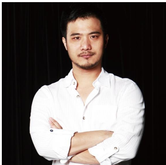
▲ 製作人 郝嘉隆